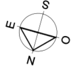
REPRESENTATION GRAPHIQUE :